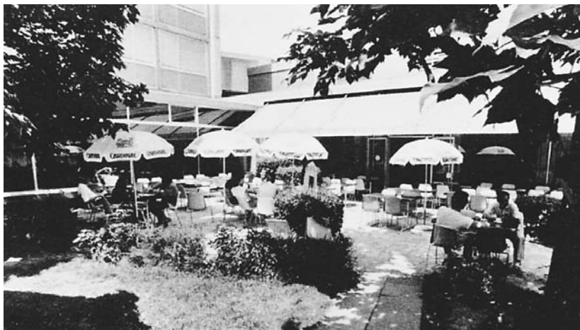
Restaurant de la Cité Universitaire